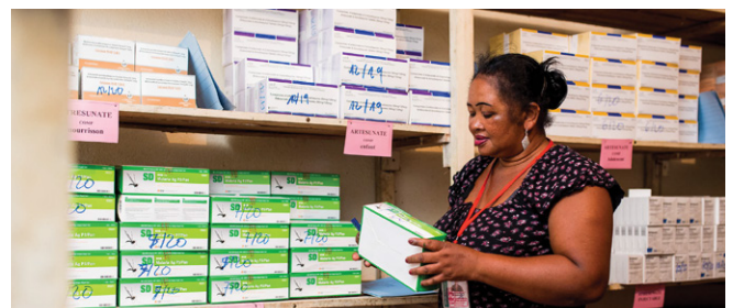
Pharmacie de Gros de District (Pha-G-Dis), Brickaville.