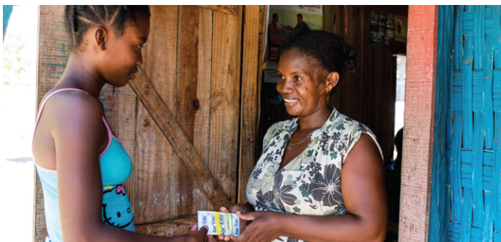
Point d'Approvisionnement (PA), Foulpointe.

L'AMT revêt une opportunité stratégique pour engager tous les acteurs du marché à collaborer, partager des informations, créer les incitations nécessaires, améliorer l'égalité et l'équité d'accès aux produits de santé à Madagascar et ainsi contribuer à assurer la couverture universelle en santé.